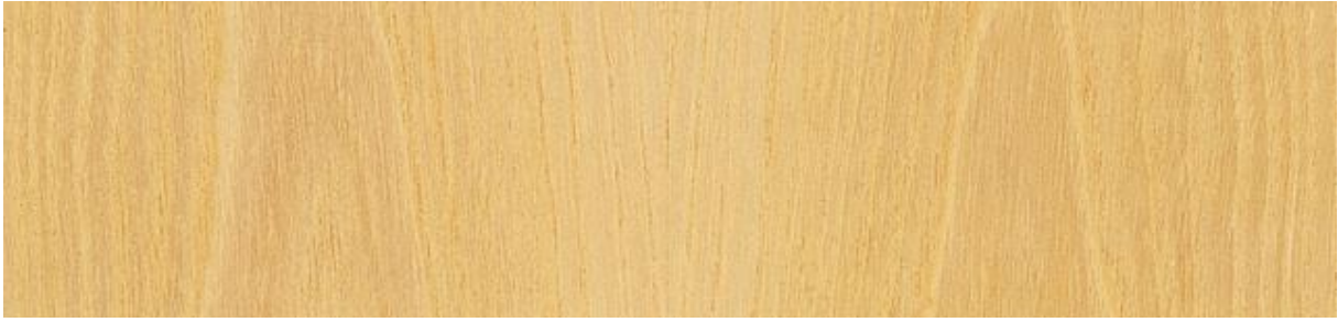
Esche – White Ash