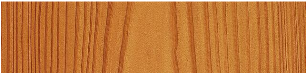
Lärche - Larch