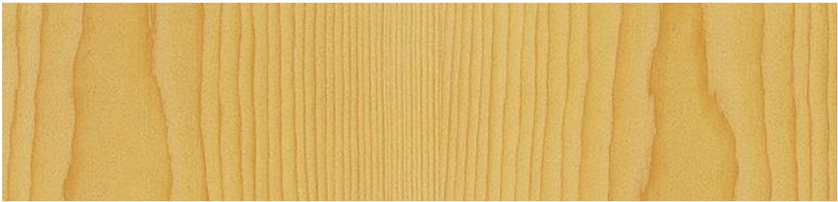
Fichte - Spruce