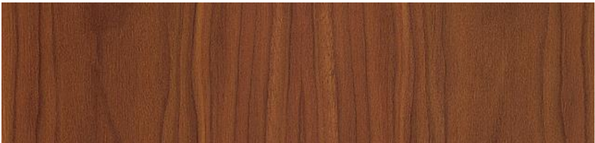
Nussbaum amerikanisch – American Black walnut