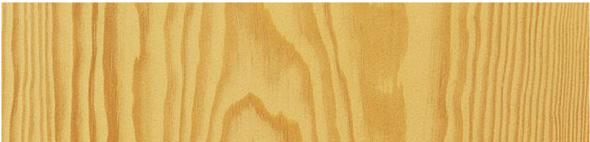
Kiefer - Pine