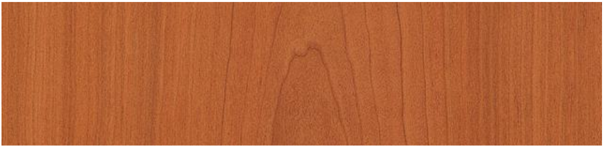
Kirschbaum amerikanisch – American Black Cherry