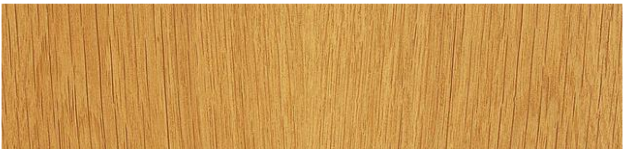
Eiche - Oak