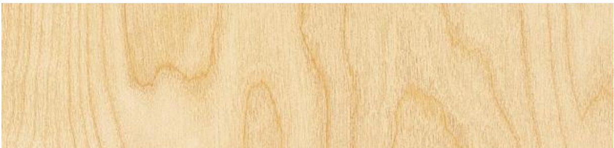
Birke - Birch