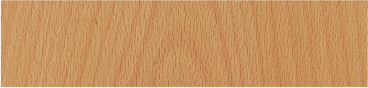
Buche - beech