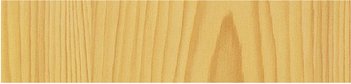
Tanne - Fir